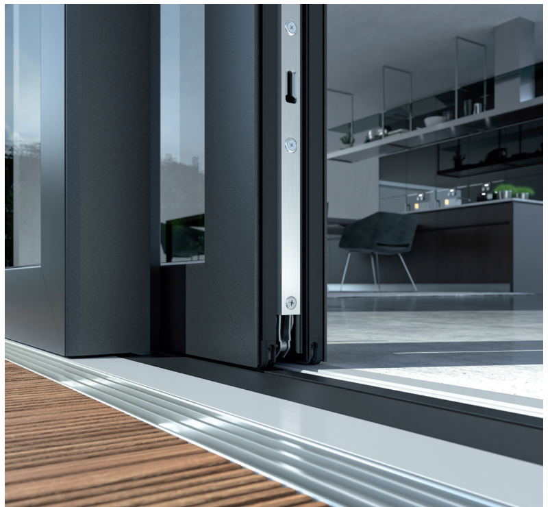
Eliminazione di ogni ostacolo o rischio di inciampo con la Soglia 0 mm di Schüco